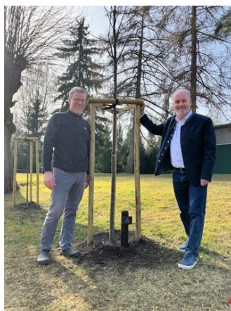
Kloster Rühn bei Bützow