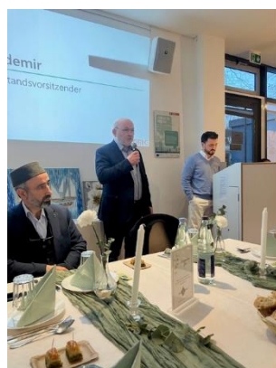
Feier mit der Moschee Gemeinde Züricher Straße

Wer meine Arbeit im Ortsamt die letzten Jahre verfolgt hat weiß, dass ich den Kontakt zu den Religionsgemeinschaften pflege. Daher bedanke ich mich auf diesem Wege nicht nur für die Einladung der Schura Bremen in die Vahr, sondern auch bei der Moschee im Schweizer Viertel und der Osterholzer Moschee im Soltend, deren Entwicklung ich von Anfang an begleite und die schon durch ihren Namen die Verbindung zum Stadtteil signalisiert.