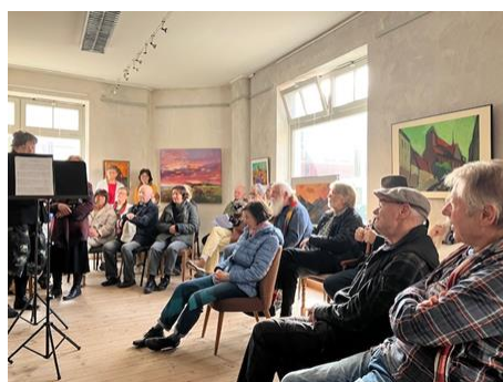
Ausstellungseröffnung im Kunsthaus Bützow