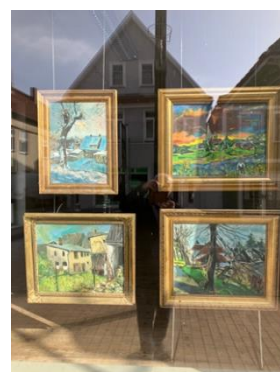
Bilder von Herrn Severin-Iben aus Bützow