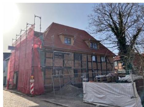
ehemalige Synagoge in Bützow